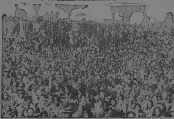
Manifestación de hambrientos en Tian Tsing durante la cual murieron ochenta personas que no habían tomado alimentos por varios días.